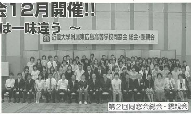
第2回同窓会総会・懇親会