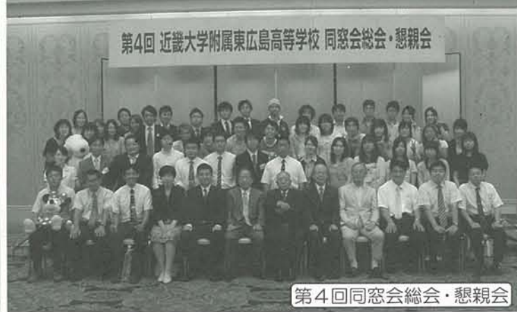
第4回同窓会総会・懇親会

卒業生の皆様、いかがお過ごしでしょうか。平成二十五年三月、第十五期卒業生二一七名を同窓会会員として迎え入れ、本校の同窓生が三〇〇〇人を超えました。これも平成八年四月に近畿大学附属福山高等学校東広島校舎として開校した当時からの諸先輩方、教職員の方々、保護者の方々、地域の方々のおかげであると感謝しております。 そんな中、私達の母校が、平成二十五年四月一日から、同一県内の近畿大学附属福山高等学校との連携をより一層強化し、近畿大学のスケールメリットを活かした教育活動を展開するため、校名を「近畿大学附属広島高等学校 東広島校」に変更いたしました。私達の母校がますます発展していけるよう、日本全国各地から同窓生も応援していきましょう。 また、今年は三年に一度の同窓会総会が開催される年です。同窓会役員も、今年の総会は一味も二味も違う会にしたいと意気込んでおりますので、より多くの同窓生が参加していただけるのを楽しみにしております。