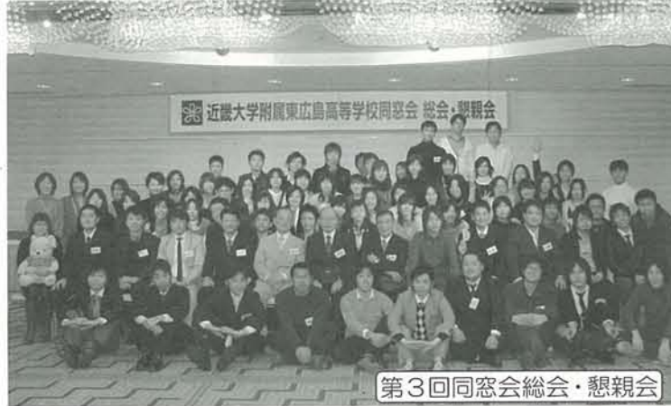
第3回同窓会総会・懇親会