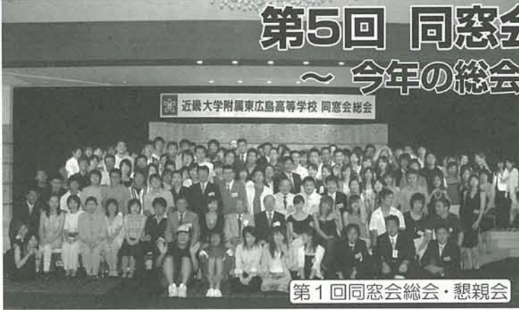
第1回同窓会総会・懇親会