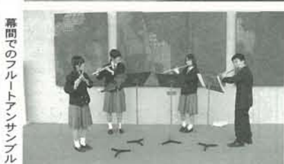
定期演奏会 盛大に開幕です。幕間でのフルトアンサンブル