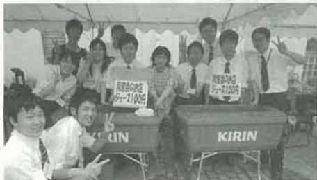
毎年恒例の同窓会のお店。教育実習生とともにジュースを売りました。