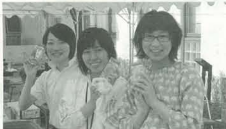
卒業生の教員もお手伝いです。

第十三回近校祭・文化祭が二〇〇九年六月十三・十四日の二日間で開催されました。今年度のテーマは「昂」く輝きの集まりです。両日とも天候に恵まれ大盛況でしたが、二日目の模擬店には生徒に混じって同窓会としてジュースの販売店を出店させて頂きました。もちろん店員は同窓生!今回は教育実習の時期が重なったこともあり、多くの同窓生にお手伝いしていただきました。来年度以降も手伝っていただける方を大募集しております。 前回の同窓会総会で第四回以降の総会が三年に一度の開催に決定したこともあり、恩師や級友と顔を合わせる機会が減ってしまい寂しい思いをされている同窓生もいるのではないのでしょうか?! そこで今回は一つ提案があります。是非、気軽に母校に足を運んでみませんか?学生時代にお世話になった先生方や級友と思えば話に花を咲かせて楽しい時間を過ごすことができますよ!! そして、来年はいよいよ第四回同窓会総会・懇親会が開催されます。同窓生の皆様のふるつてのご参加お待ちしております。(詳細は同窓会報6号で) また、今年度は八月一日に本校の同窓会室にて同窓会予算承認委員会が開催されます。詳細は下記の通りですので併せてよろしくお願ひします。