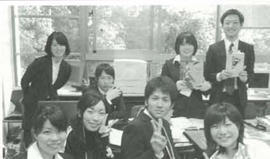
教材研究の合間の写真