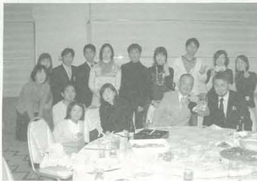
村尾先生と1期生・4期生の方々