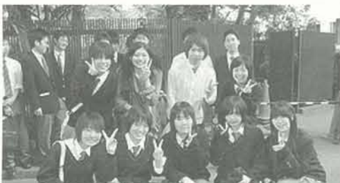
山口大学でも同窓生が来てくれました。

毎年行われている四月の高二・三生参加の大学見学会(一泊二日)では、大学訪問に来てくれた後輩達に先輩である同窓生