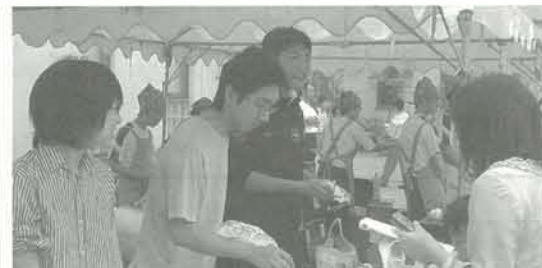
本校教員でもある同窓生も大活躍。