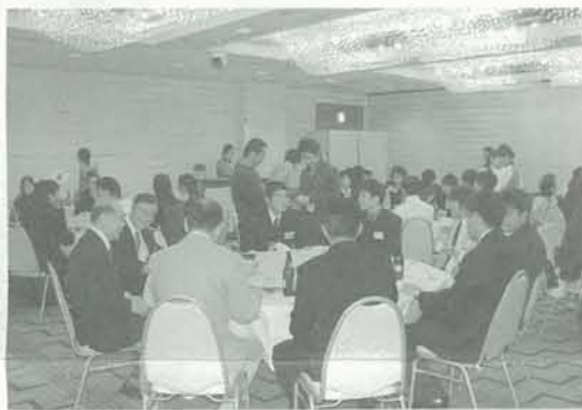
参加された先生方のテーブル

第三回同窓会総会・懇親会は昨年同様、ホテルグランヴィア広島にて二〇〇七年十二月二十九日盛大に開催されました。過去二回がお盆前後開催ということもあり、今回は同窓生の参加状況把握なども兼ねて年末開催となりました。一期生から九期生まで多くの方々に参加して頂き、大盛況の中、総会と懇親会を行いました。総会では、同窓会総会開催についての提案・同窓会収支報告がされました。懇親会では、年々レベルアップする景品に参加者もドキドキのビンゴ大会もあり、お世話になった先生やクラスメイトとの久しぶりの再会に貴重な時間を大いに盛り上げました。なお同窓会総会・懇親会につきましては第三回同窓会総会で、三年に一度の開催と決定されました。毎年の同窓会収支報告については別途、報告の機会を設けることで同窓会承認されましたのであわせて御連絡します。今後とも同窓生の皆様のふるってのご参加お待ちしております。