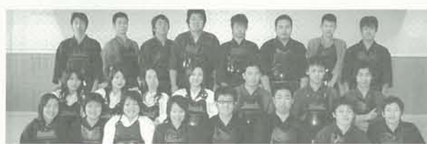
合同教室でOB・OGとの記念撮影、3期生から10期生が顔を合わせました。

毎年一月三日にOB稽古会を実施しています。OB・OGのみならずぜひご参加下さい。