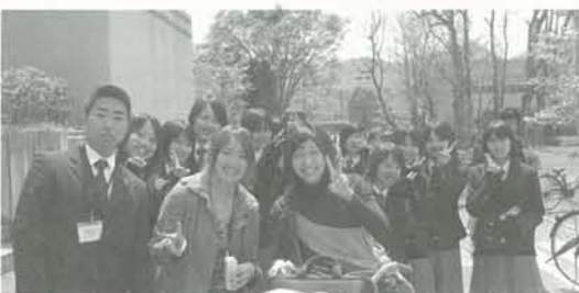
同窓生と在校生の記念撮影