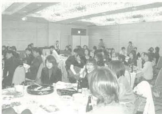
今年初めて参加された同窓生も多いようです