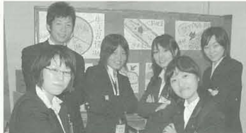
3~4週間の教育実習生である同窓生のみなさん

私は、今回実習生として近校へと帰ってきました。久しぶりの学校は、とても懐かしく、中高生のころの思い出がたくさん蘇ってきました。しかし、今回は実習生という立場として学校にいるので、ただ懐かしい...という気持ちと共に、緊張感