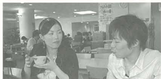
あこがれの大学に通われている先輩。