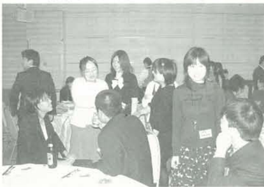
恩師との会話（学校内では見えなかった一面が見えるかも）