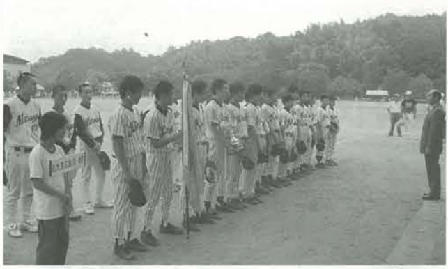
念願の広島県大会優勝を勝ち取った本校中学ソフトボール部