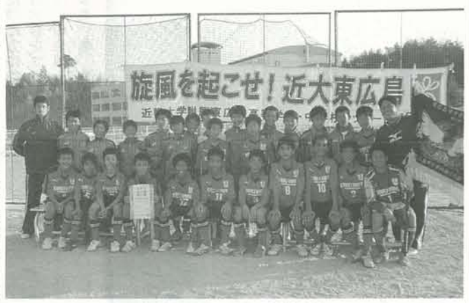
東広島市中学校の頂点に輝いた本校中学サッカー部