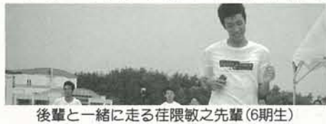
後輩と一緒に走る在限教之先輩(6期生)

OB会といたって大規模な集まりはないですが、先輩方が機会を見てはグラウンドに後輩の様子を見に来てくれます。お盆前後の校内合宿では、一緒に練習に取り組むこともあります。