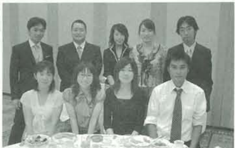
同窓会事務局役員